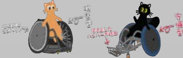
攻撃型は、高いバックで動きが速く、ボールを運ぶのに適しています。 守備型は、低いバックで動きを止め、ボールを奪取するのに適しています。

競技用の車いすには、攻撃型と守備型の2種類があります。攻撃型は主にハイポインターの選手、守備型は主にローポインターの選手が使用します。