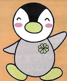
民生委員・児童委員イメージキャラクター「ミンジー」