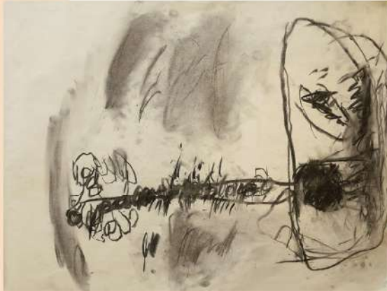
《ギター》2021~2022年、特定非営利活動法人希望の園蔵 Guitar, 2021-2022, Collection of Kibou-no-Sono(The garden of hope)