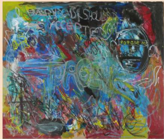
《FORGIVE》2024年、平川市地域活動支援センターおらんど蔵 FORGIVE, 2024, Collection of All Round