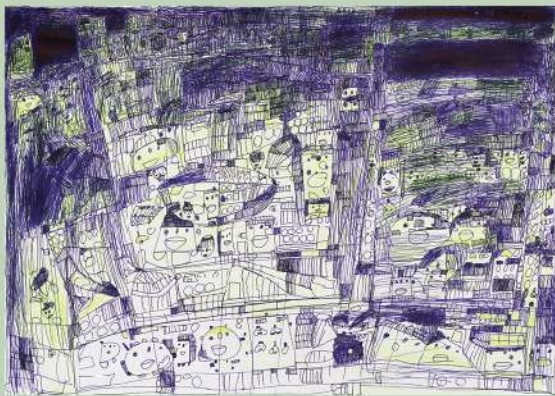
《Untitled》制作年不詳、社会福祉法人みぬま福祉会工房集蔵 Untitled, Date Unknown, Collection of Kobo-Syu

Matsui expresses familiar themes such as flowers and fruits using acrylic and watercolor paints, with free use of color and form. Having created over 600 paintings to date, she continues to actively produce art. Her work has been featured in exhibitions including "The Nippon Foundation DIVERSITY IN THE ARTS The 4th International Art Exhibition" (2022, Bunkamura Gallery / Wall Gallery and elsewhere).