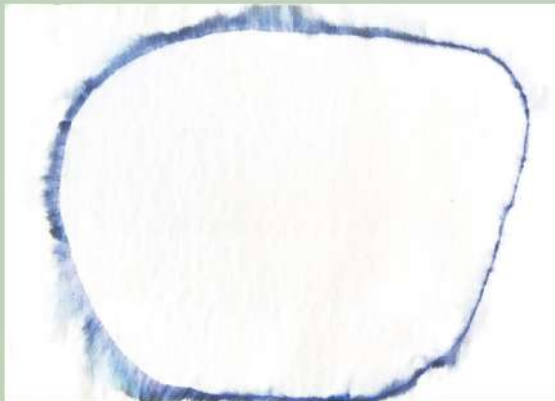
《無心》2020年、株式会社 nullus 蔵 No-Mindedness, 2020, Collection of nullus Inc.