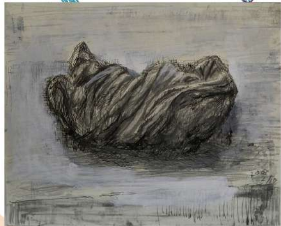
《雑巾の譜》2018年、クシノテラス(榑野展正)蔵 Chronicle of My Cleaning Rags, 2018, Collection of KUSHINO Terrace (KUSHINO Nobumasa)

Shibata consistently creates works themed around soap bubbles. Recently inspired by the unique sensation and sound of drawing on canvas with ballpoint pen, he continues to produce his works with great enthusiasm. His art has been featured in exhibitions such as "Art Brut from Japan, Another Look"(2018, Collection de l' Art Brut, Lausanne, Switzerland).