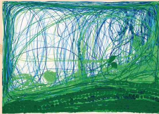
《せっけんのせ》2006年、社会福祉法人みぬま福祉会工房集蔵 Soap, 2006, Collection of Kobo-Syu

It depicts subjects of personal interest such as animals and guitars, using charcoal. His works express dynamic energy, combining powerful lines and soft blending techniques applied by finger. Notable exhibitions include "LoVE GifTed: Mie's Untamed Artists" (2023, Mie Center for the Arts).