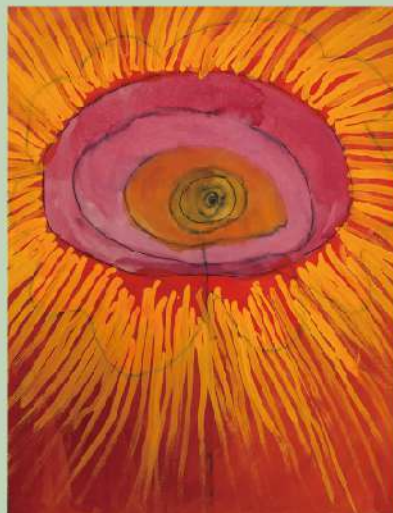
《彼岸花》制作年不詳、作家蔵 Red Spider Lily, Date unknown, Collection of the artist

Tsuhishashi vividly depicts familiar subjects such as flora and fauna using water-based pens and acrylic paints. In 2022, she relocated to Midori Ward, Sagami-hara City, where she continues to create not only paintings but also ceramics and beadwork in an environment surrounded by nature. A notable project she participated in is the "SDGs Color Art Project" (2022).