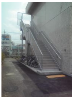
適応支援室 入り口