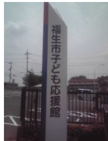
子ども応援館看板

始業前の時間やフリータイムを活用し、遊びやスポーツを通して協調性や体力の向上を図るとともに、心理的安定につとめ、豊かな人間関係づくりを積極的に行います。