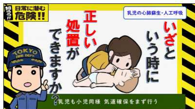
乳幼児編【応急手当】